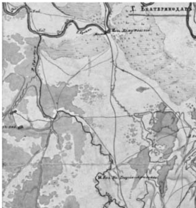
Рис. 1. Фрагмент пояснительной карточки военных действий в земле шапсугов в 1860 году [23, л. 1].

чища Хомуты, а у западной оконечности последнего, на левом берегу, также начиналась низменная болотистая местность, доходившая до самого впадения Афипса в Кубань (рис. 1). Кроме того, южная часть Карасунского кута на правом берегу Кубани также была занята болотистой пойменной террасой [2, с. 36]. Таким образом, переправа у Екатеринодарской крепости была крайне затруднена, а в определенное время года, по всей видимости, вообще невозможна.