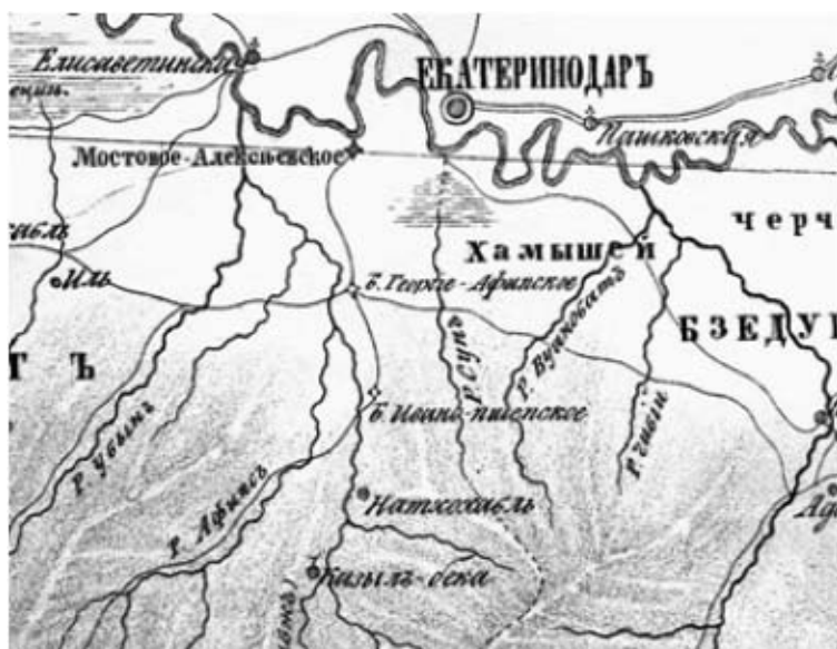
Рис. 4. Фрагмент карты Закубанских горских народов, 20 верст в дюйме, 1857, г. Тифлис.

Немаловажным фактором при выборе места закладки укрепления являлась высота берега реки, безопасность местности с точки зрения риска подтопления. В рассматриваемом нами возможном месторасположении Георгие-Афипского укрепления высота берега незначительна, в то время как ниже по течению реки, в районе современного железнодорожного моста, правый берег имеет достаточно высокий склон. Однако отметим, что в архивных документах имеются сведения о планировавшемся в первой половине 40-х гг. XIX в. переносе Афипского укрепления из-за постоянного подтопления [14, л. 2 об, 9]. Так, описание одного из подобных наводнений приводит Ф. А. Щербина: «Вода держалась на два фута выше контр-эскарпов в продолжение двух суток. Гарнизон, отрезанный с крепостью от суши, не имел возможности известить о своем критическом положении