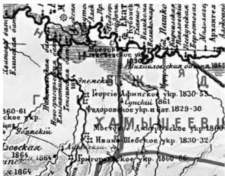
Рис. 5. Фрагмент военно-исторической карты Северо-Западного Кавказа 1774–1864 гг., 20 верст в дюйме, сост. Е. Д. Фелицын

плане 1865 г. [29, с. 491]. В архивных документах 1810 г., хранящихся в Государственном архиве Краснодарского края, точных сведений о местоположении устроенного на Афипсе редута не обнаружено (см.: [3] [4, т. I, т. II]). Зато указана цель его постройки: «...Чтоб непримиримые сапсуги были всегда войсками нашими [тревожимы], лишились бы лучшей своей земли, нужной им для хлебопашества и скотоводства» [4, л. 39 об], что схоже с задачами укреплений на Афипсе и Шебше 1830 г.