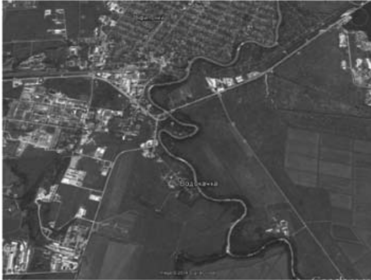
Рис. 2. Спутниковый снимок местности в районе устья реки Шебш и станицы Георгие-Афипской. № 1 – место расположения укрепления на Афипсе на плане 1865 г., № 2 – место расположения укрепления на Афипсе на плане 1836–1838 гг.

укрепления, указан тет-де-пон – мостовое укрепление. Однако план 1830 г. дает нам лишь крайне приблизительное представление о расположении укрепления на Афипсе, т. к. изобразил русло реки весьма условно, без прорисовки деталей.